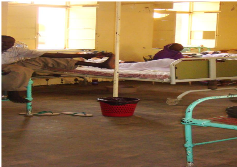
SORTING OF THE WASTE MATERIALS